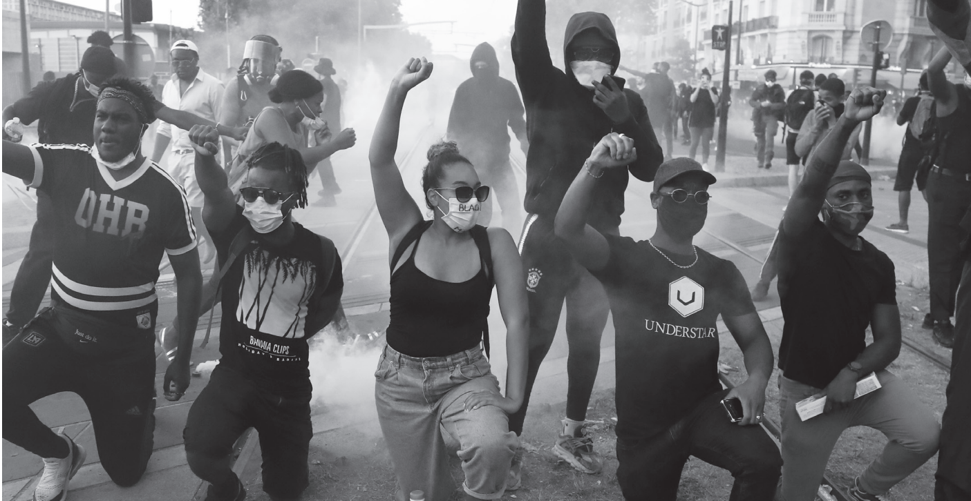
George Floyd için Paris'te gerçekleştirilen eylem. 20 bin kişinin katıldığı eyleme polis saldırmıştı

Kapitalizmin uluslararası durumuna ve kitlelerin ayaklanma ihtimaline yanıt ararken, Amerika'daki kitlesel hareket muhtemel halk hareketlerinin nasıl bir rota ve nasıl bir ivme kazanabileceğine yanıtıdır.